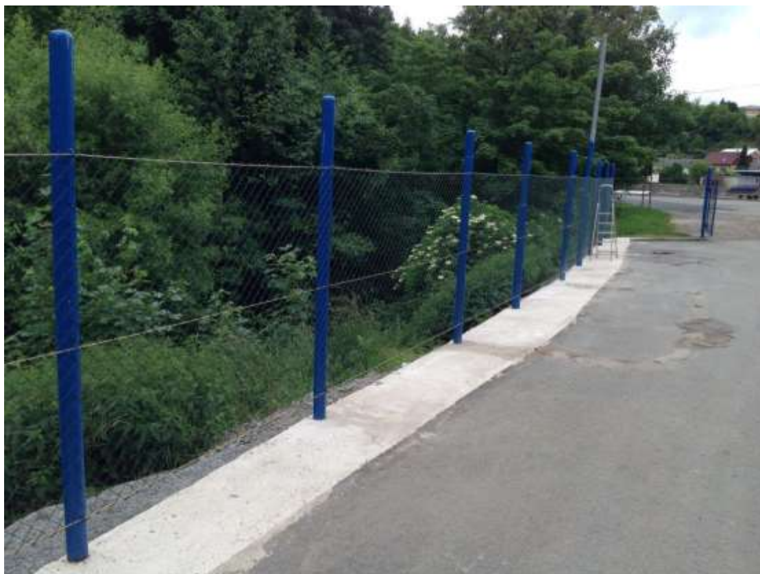
plot a manipulační cesta