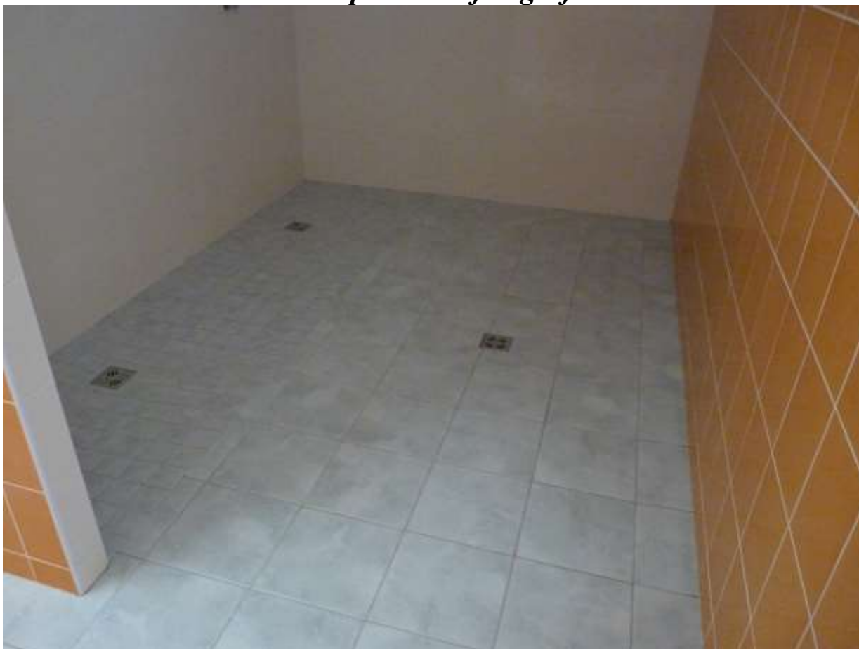
sprchy na koupališti